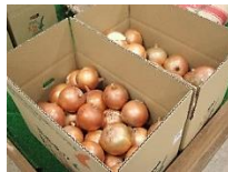
1箱 5kg / 10kg

肥沃な土壌と瀬戸内海特有の温暖な気候の中、時間をかけてじっくり育てられるため、肉厚で柔らかく、みずみずしい玉ねぎが生まれます。全国配送にて美味しい玉ねぎをお届けします。