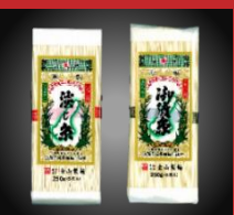
◎淡じ系5束 ◎御陵系5束 製造:金山製麺

淡路島の手延べそうめんは今からおよそ180年前の江戸時代、天保年間に伝承されました。繊細で、ツルツとした「のどごしの良さ」、しっかりした「麺のこし」、糸手師(いとでし)の伝統製法による細く美しいそうめんです。