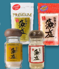
製造:多田フィロソフィ

「淡路島の藻塩」は、ホンダワラの海藻の旨味をじっくりと閉じ込めたミネラルたっぷりの塩。海藻を利用して塩をつくる古代の製法「藻塩焼き」を現代的な独自の製法で再現。ほのかな海藻の香りとまろやかな味が美味。天ぷらや唐揚げ、豆腐などの付け塩にピッタリ。